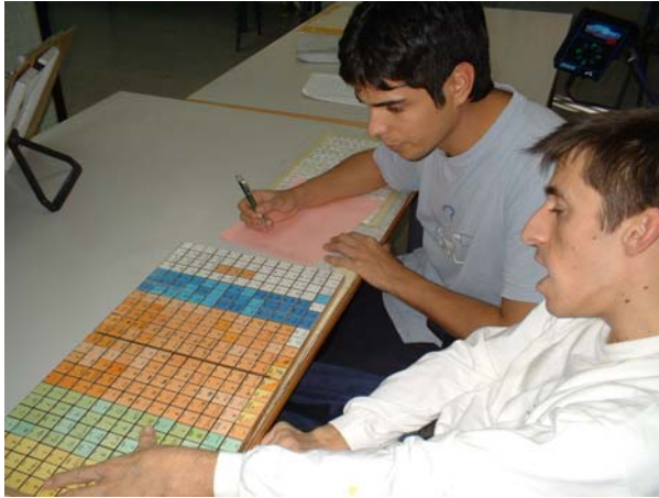
Imagen 1: Tablero físico

Podemos observar las dificultades de acceso del usuario, la saturación de pictogramas que limita su crecimiento, y la necesidad de recibir una atención exclusiva para elaborar un mensaje complejo, que limita la interacción con otros usuarios de SAC e interlocutores no expertos