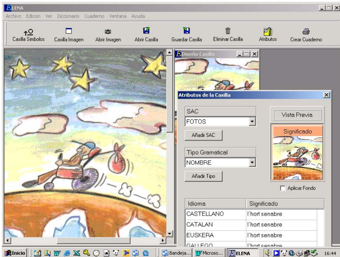
Imagen 2: Creación de un pictograma asignándole atributos a una imagen capturada desde un archivo.

Por un lado, podemos capturar imágenes (fotografías, dibujos,...), desde un archivo, para convertirlas en pictogramas (véase Imagen 2). Por otro, podemos dibujar iconos del sistema Bliss, a partir de sus elementos base (alfabeto Bliss), como se observa en la Imagen 3. . De este modo podemos crear bibliotecas de sistemas estandarizados, o bien, crear nuevos pictogramas de uso individualizado (por ejemplo a través de fotografías de personas, objetos o entornos particulares). Ello permite la creación de tableros con vocabulario individualizado y adaptado a la realidad personal. El significado (texto) que atribuyamos al pictograma será utilizado por el conversor texto-voz para generar el mensaje.