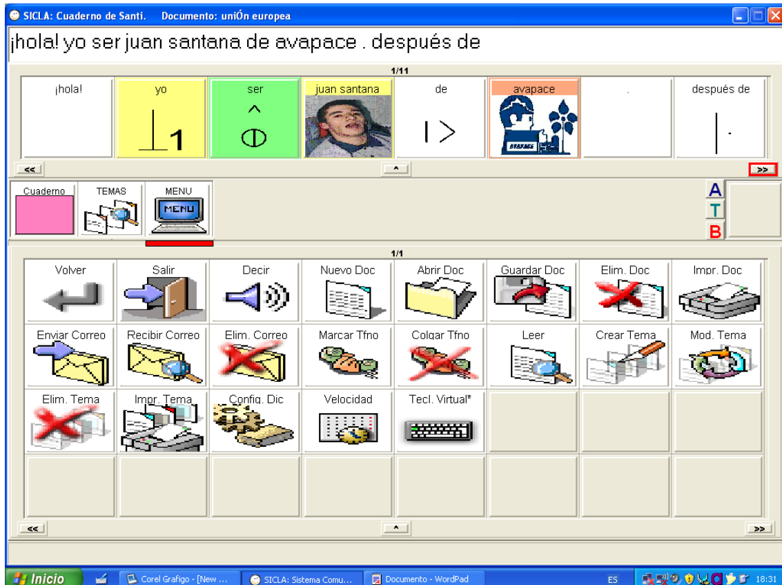
Imagen 5: Menú de funciones

Las funciones del menú que hayamos asignado en gestión de usuarios estarán presentes en una tabla (véase Imagen 5). De esta forma podemos seleccionar los elementos que son utilizables, evitando la presencia de botones cuyas funciones son desconocidas o no adecuadas para un determinado usuario.