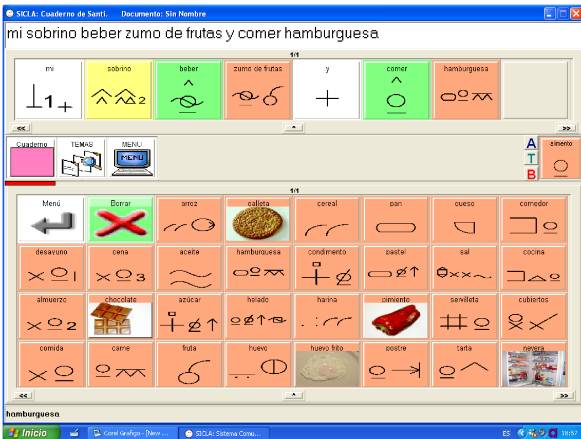
Imagen 6: Tabla cuaderno del usuario dentro del tema alimentos

Las diferentes tablas donde se presentan los pictogramas pueden estar estructuradas en temas de comunicación, en categorías gramaticales, o bien se pueden cruzar ambos criterios: disponer de un tablero estructurado en temas y cada tema a su vez en categorías gramaticales. De este modo se pretende respetar las diferentes tradiciones o estilos de elaboración de tableros físicos de comunicación y, en definitiva, satisfacer las diferentes necesidades de usuarios con características muy variadas. En la Imagen 6 se ilustra un cuaderno (tablero que no se estructura por categorías gramaticales) compuesto de una serie de tablas que representan áreas temáticas de comunicación. Cuando seleccionamos un tema aparece activo en el recuadro de la derecha y abajo aparecen los pictogramas (vocabulario) que ha sido asignado a dicho tema. Seleccionando los iconos de la tabla se elabora el mensaje en la parte superior de la pantalla.