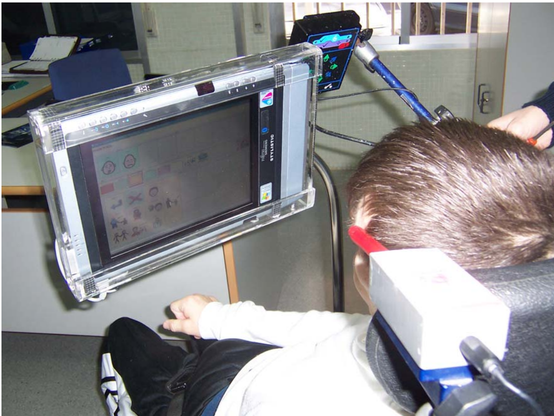
Imagen 8: Integración de Sicla en un Tablet PC adaptado para personas con discapacidad motriz. Desarrollado en AVAPACE gracias a la financiación de fondos europeos derivada del proyecto ACCESO CAPAZ.

Las ventajas de concentrar el desarrollo en un software son, fundamentalmente, que es sencillo distribuirlo y se pueden realizar actualizaciones de una forma relativamente sencilla. Pero sabemos que un programa informático no funciona "en el aire". Necesita un soporte físico para funcionar. El ordenador de sobremesa es una herramienta adecuada para elaborar documentos y gestionarlos, incluso para la comunicación a distancia (correo electrónico y llamada telefónica), pero no es una herramienta adecuada para la comunicación diaria, que es una necesidad básica y se produce en cualquier contexto. Es por ello que los profesionales de la comunicación, los usuarios de CAA y los diseñadores en general, debemos realizar los esfuerzos necesarios para llegar a una convergencia real entre las necesidades de comunicación de las personas con capacidades diferentes y los nuevos desarrollos de hardware de alta portabilidad. De este modo podremos tener disponibles los programas informáticos de comunicación en cualquier contexto, lo cual supone un salto trascendental en la independencia personal y en la calidad de vida de las personas con dificultades para la comunicación.